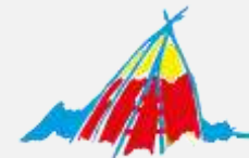
Tore Hund på Sør-Troms museum