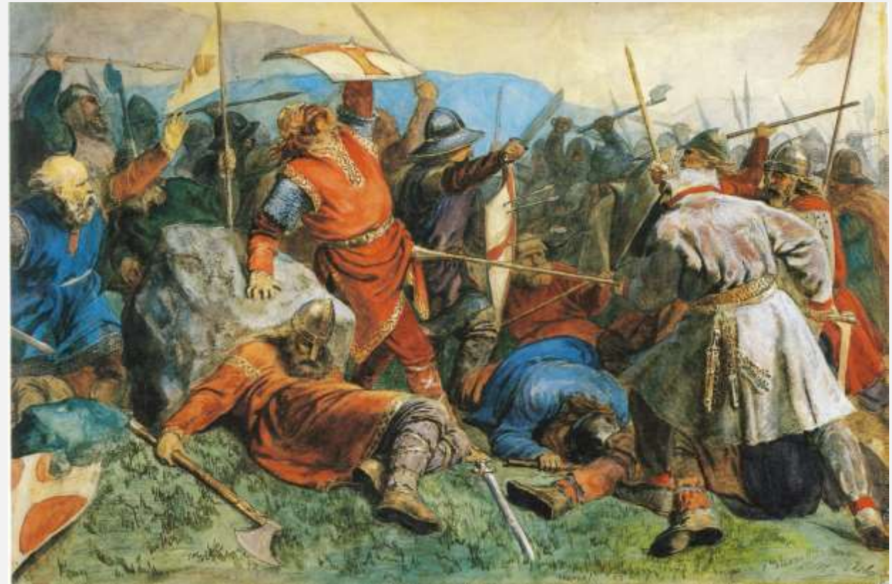
Peter Arbo, ca. 1870